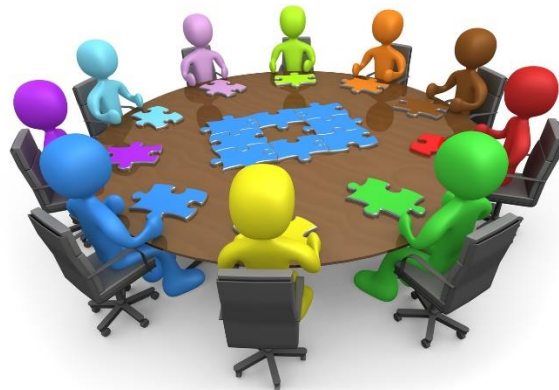
Abbildung 1: Teambesprechung

Unser pädagogisches Team ist multiprofessionell ausgebildet und besteht aus neun Erzieherinnen sowie einem Erzieher, einer Kinderpflegerin, zwei Kindheitspädagoginnen (B.A.) und einer Magister Pädagogin (M.A.).