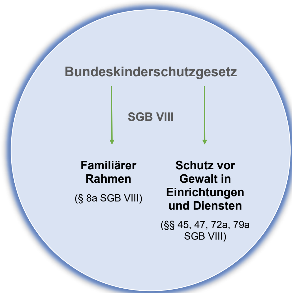
Abbildung : 2 Schaubild Bundeskinderschutzgesetz